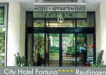
City Hotel Fortuna ★★★★★ Reutlingen