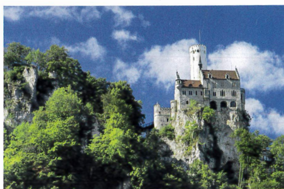
Das Märchenschloss Lichtenstein thront über dem Echaztal