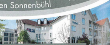
Alhotel Fortuna ★★★★★ Riederich | Metzingen