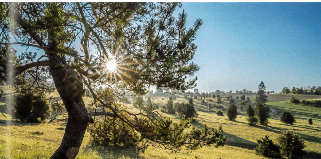
Sonnenaufgang auf einer Wacholderheide

Golf-Club Reutlingen- Sonnenbühl (S. 82) www.albgolf.de