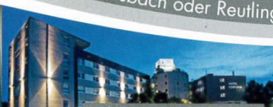
Hotel Fortuna ★★★★★ Reutlingen | Tübingen